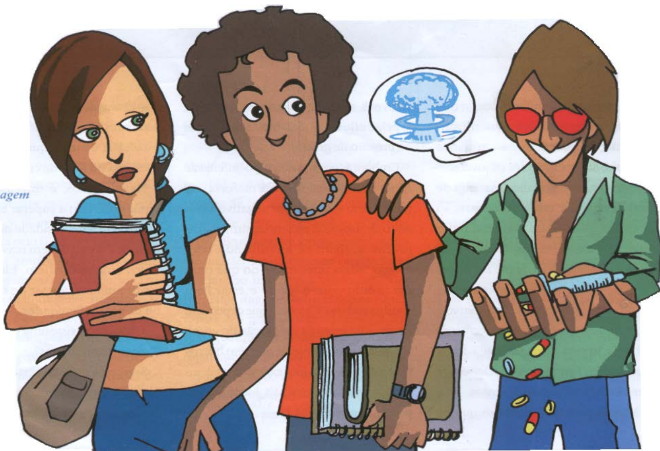
Ilustração: André Barbosa